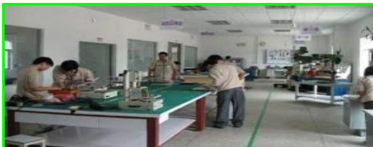
自動化課工作室：設計・製作