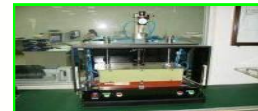
自動バルブ取付機 (スピードメータ用)