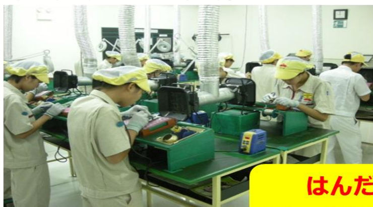
はんだつけ トレーニングルーム