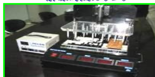
ファンクションテスタ