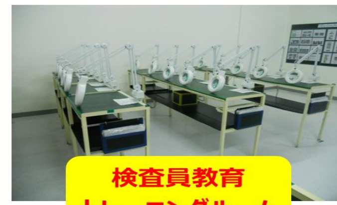
検査員教育 トレーニングルーム