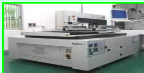
レーザーカッター