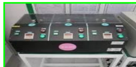
クリームはんだ 解凍時間カウンター