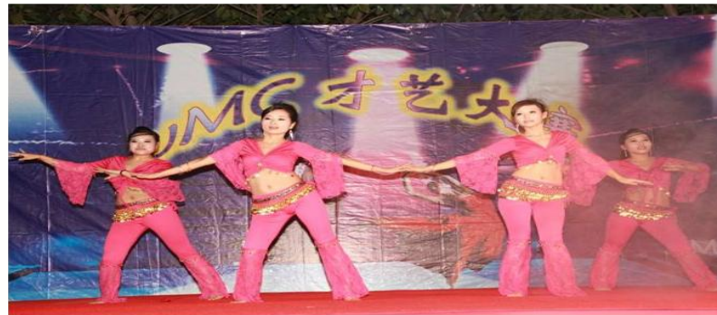
才艺大赛 (每季度/次)