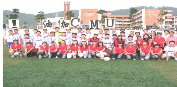
足球队球员与啦啦队