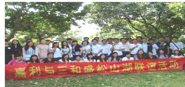
单身交友联谊会 (季度/次)